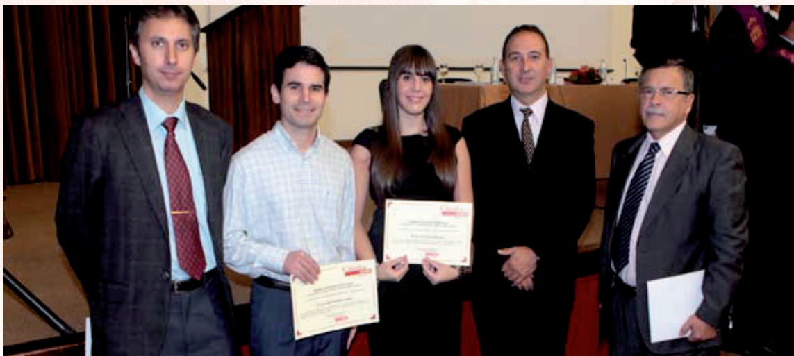
Entrega del Premio Cátedra CEPSA 2010

En el Acto de Graduación y Lección Inaugural del Curso 2010-11 de la Escuela Politécnica Superior de Algeciras, celebrado el 22 de octubre, se realizó la entrega de los Premios Cátedra CEPSA 2010.