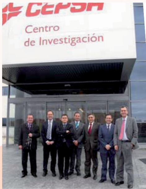
Integrantes de la reunión-visita

CEPSA dispone de un moderno Centro de Investigación en Alcalá de Henares en unas instalaciones de 12.000 m 2 . Las principales actividades se centran en el desarrollo y optimización de productos y procesos, síntesis y selección de catalizadores, así como el apoyo a las incidencias que surgen en las diversas unidades productivas.